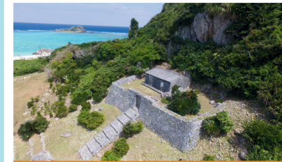
玉御殿/伊是名城址

集落を過度な露出や水着で歩いたり、住民の敷地内に勝手に入って撮影したりすることはやめましょう。ポイ捨ては絶対にNGです