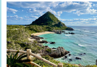
シラサギ展望台/ギター展望台

日本の渚百選の二見ヶ 浦海岸が一望できる2 か所の展望台。透明な 海の底の珊瑚礁が美し い。