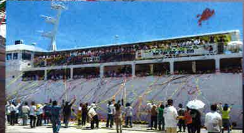
“にふえーでーびる” 仲間の方言で「ありがとう」の意味

伊是名島へのアクセスは、仲田港-運天港(今帰仁村)を結ぶカーフェリーでの船旅となります。